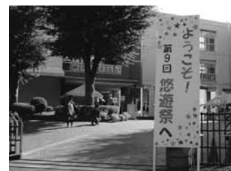
【昨年の悠遊祭の様子】

当日は自動車・バイクでの来校はご遠慮ください。また、近隣の方々のご迷惑となりますので、学校周辺での路上駐車はおやめください。