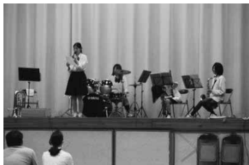
吹奏楽部による演奏もありました

生徒総会終了後、引き続き「部・同好会・委員会説明会」が行われました。それぞれの団体がパンフレットや発表に工夫を凝らし、笑いを誘う説明や音楽関係を中心とした実演もあり、楽しい会になりました。