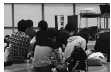
【昨年度の生徒総会の様子】

生徒総会では今年度の予算案承認、役員紹介などを行います。また、生徒総会終了後、部活動紹介も行われます。部活動に関心のある人は参加してください。本校では 学習が着実に進んでいる人 しか入部することができません。入部を考えている人も、そうではない人も、5月、6月と、まずしっかり学習に取り組みましょう。